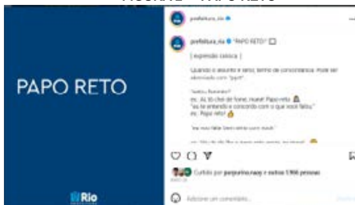
Imagem do Instagram da Prefeitura Rio 3

Apresença de expressões populares, como “tá mec” e “papo reto” (“tá mec” para indicar o “tudo bem, tá tranquilo, sem estresse” e “papo reto” enquanto concordância